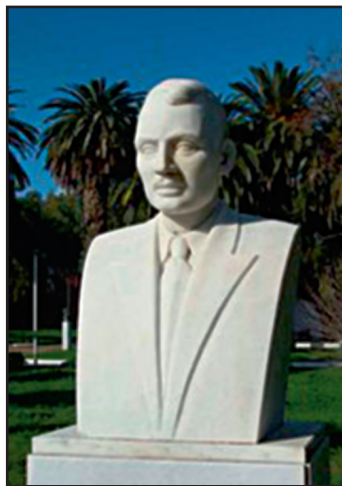
Προτομὴ τοῦ Γ. Βερίτη (Ἀλεξάνδρου Γκιάλα), πού εὐρίσκεται στὸ Δημοτικὸ Κῆπο τῆς Χώρας τῆς Χίου.

Τὸ ἀνωτέρω Ποίημα ἀνήκει στὴν ἐκδομένη Συλλογὴ « Γ. Βερίτη ΠΟΙΗΜΑΤΑ », Ἐκδόσεις «Δαμασκός», Ἀθῆναι 1958, σ. 271 (σύνολο σελίδων 314). Ὑπάρχει καὶ τόμος μὲ τὰ «ΠΕΖΑ» κείμενά του, τὰ ὁποῖα εἶναι πολὺ ἀξιόλογα ἐπίσης.