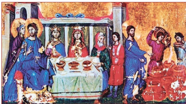
Ὁ Γάμος τῆς Κανᾶ, ἀπὸ χειρογράφο τῆς Ἱερᾶς Μονῆς Ἰβήρων, Ἅγιον Ὅρος.

Ὁ δὲ μεγάλος πατέρας τῆς Ἐκκλησίας μας, Ἅγιος Νικόδημος ὁ Ἀγιορείτης, σχολιάζοντας τὸ γνωστὸ χωρίο τοῦ Ἀποστόλου Παύλου, «Τίμιος ὁ γάμος καὶ ἡ κοίτη ἀμίαντος» (Ἐβρ. 23, 3), συνηγορεῖ ὑπὲρ τῶν θέσεων τῶν προγενεστέρων Πατέρων 16 λέγοντας: «Τίμιος δὲ λέγεται ὁ γάμος καὶ ἡ κοίτη ἀμίαντος,